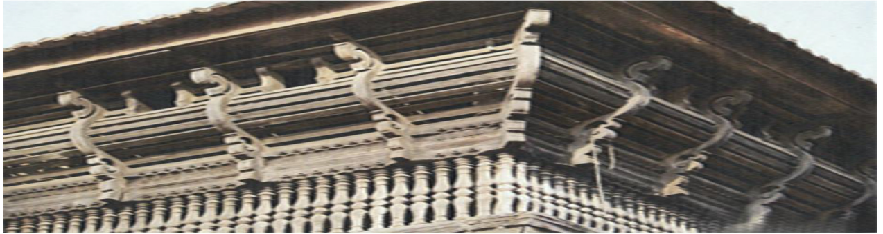
Architecture of Valluvanad Temple(Corner View)

One of the ancient talented caste Thachan (തക്ഷൻ/തച്ചൻ) exist that convincing Holy Text Mahabharatam, Vishwakarma Puranam, Bible etc. Population 400000 (Four Lakhs)